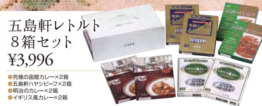
五島軒レトルト 8箱セット ¥3,996

●イギリス風カレー×1缶 ●メモリアルリッチ鴨カレー×1缶 ●パンキンポタージュ×1缶 ●カレー百年物語×3箱 ●明治のカレー×3箱