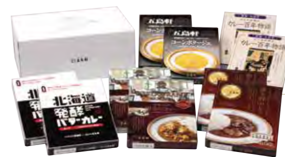
五島軒レトルト 10箱セット ¥5,248

●究極の函館カレー×2箱 ●五島軒ハヤシビーフ×2箱 ●明治のカレー×2箱 ●イギリス風カレー×2箱