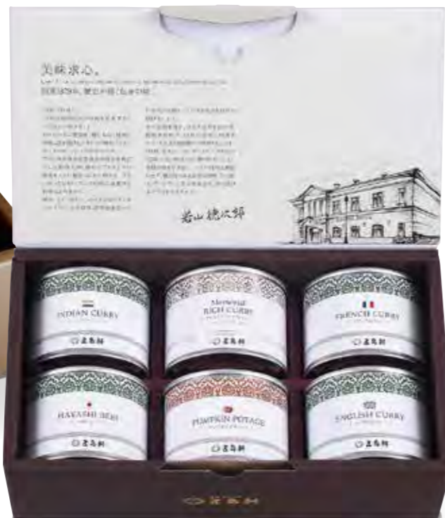
五島軒缶詰6缶 《弥生》 ¥4,860

●イギリス風カレー×1缶 ●フランス風カレー×1缶 ●インド風カレー×1缶 ●パンキンポタージュ×3缶