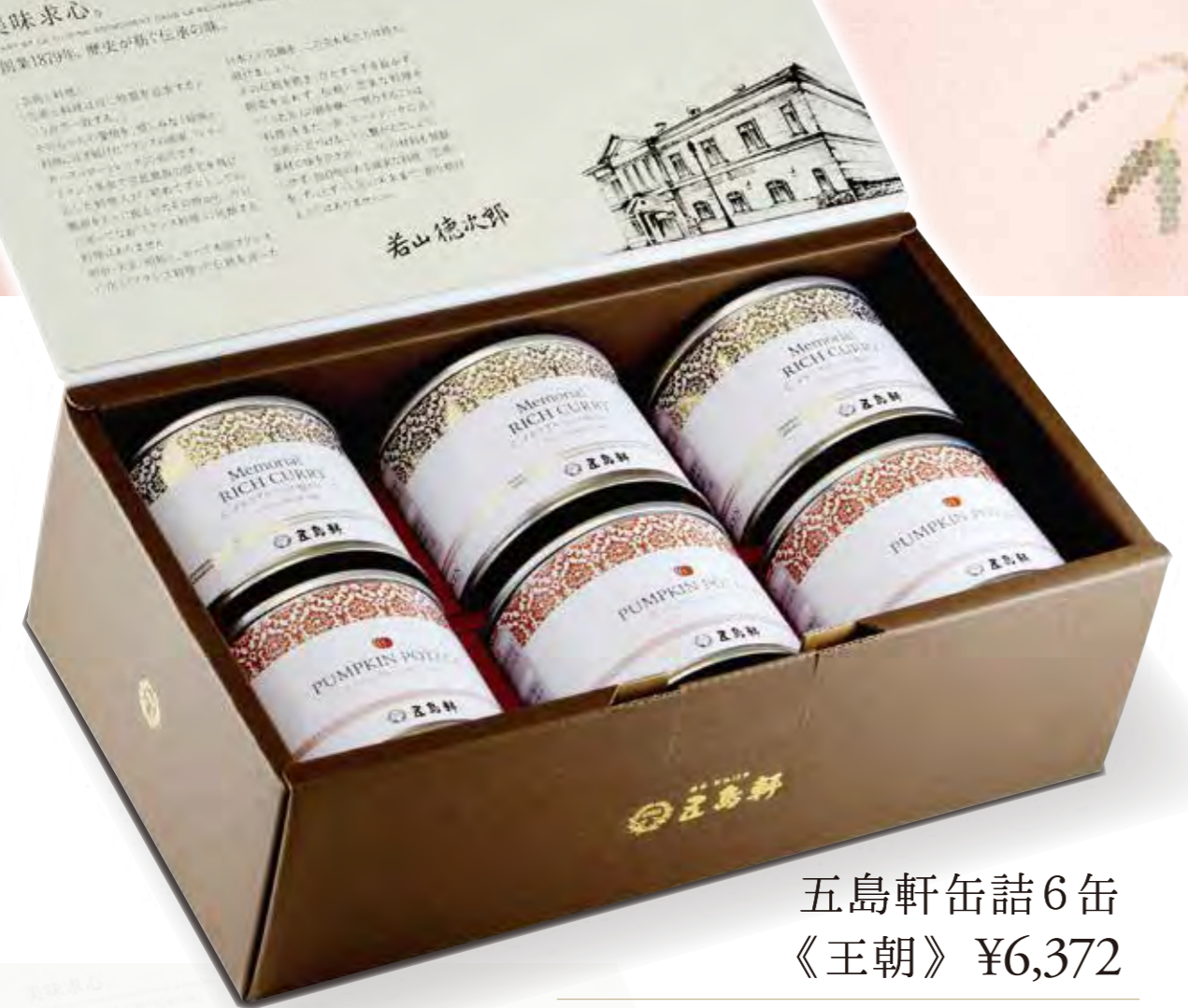
五島軒缶詰6缶 《王朝》 ¥6,372