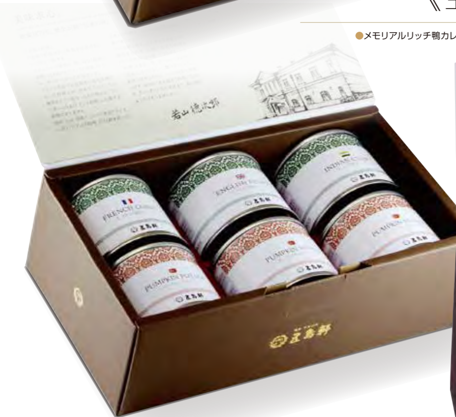
五島軒缶詰6缶 《末広》 ¥3,456

●北海道発酵バターカレー×2箱 ●明治のカレー×2箱 ●蘆火野カレー×2箱 ●カレー百年物語×2箱 ●コーンポタージュ×2箱