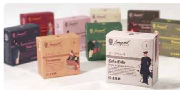
ブーケシリーズ 9箱ギフト ¥4,968

●イギリス風カレー×1缶 ●フランス風カレー×1缶 ●インド風カレー×1缶 ●メモリアルリッチ鴨カレー×1缶 ●ハヤシビーフ×1缶 ●パンキンポタージュ×1缶