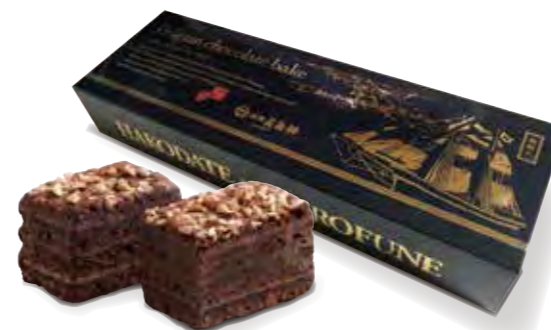
ベルギーチョコレートブラウニー ¥1,620

●ソーフケーキ ●レジャーニー ●ポルポローネ ●抹茶カステラ ●ブランデーケーキ ●函館サンドケーキ ●ポテロン ●バターサブ ●ベルギーチョコレートブラウニー