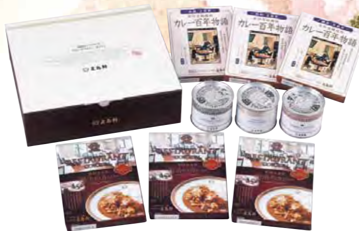
五島軒 缶詰・レトルトセット ¥5,994

●イギリス風カレー×1缶 ●メモリアルリッチ鴨カレー×1缶 ●パンキンポタージュ×1缶 ●カレー百年物語×3箱 ●明治のカレー×3箱